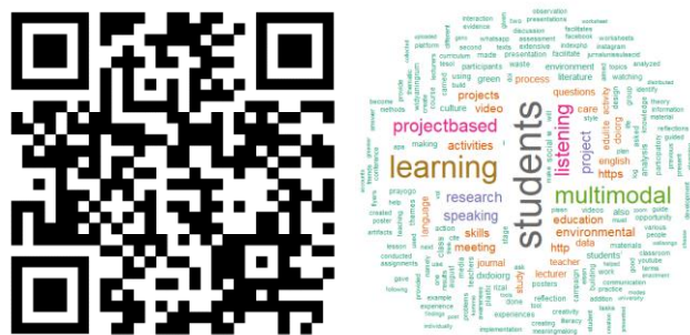
Gambar 5. Article file dan word cloud analisis data mining pada artikel “ Multimodal Project-Based Learning in listening and speaking activities: Building environmental care? ”.

Kami menemukan 10 kata-kata yang paling banyak muncul pada masing masing artikel yang dilakukan analisis data mining. Berdasarkan abstrak artikel “ Multimodal Project-Based Learning in listening and speaking activities: Building environmental care? ”, kata yang paling sering muncul adalah students sebanyak 140 kali, learning sebanyak 106 kali, multimodal sebanyak 78 kali, listening sebanyak 64 kali, projectbased sebanyak 56 kali, research sebanyak 41 kali, project sebanyak 39 kali, speaking sebanyak 38 kali, environmental sebanyak 34 kali, activities sebanyak 29 kali. Secara lengkap, analisis data mining pada artikel tersebut tersedia pada Gambar 5