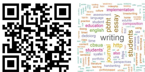
Gambar 1. Article file dan word cloud analisis data mining pada artikel “ Overseas and home students’ perspectives towards the implementation of portfolio-based timed-writing technique in composition class ”.

Kami menemukan 10 kata-kata yang paling banyak muncul pada masing masing artikel yang dilakukan analisis data mining. Berdasarkan abstrak artikel “ Overseas and home students’ perspectives towards the implementation of portfolio-based timed-writing technique in composition class ”, kata yang paling sering muncul adalah writing sebanyak 83 kali, students sebanyak 70 kali, essay sebanyak 67 kali, pbtht sebanyak 63 kali, journal sebanyak 57 kali, http sebanyak 53 kali, cbsua sebanyak 44 kali, english sebanyak 42 kali, students’ sebanyak 41 kali, dan education sebanyak 37 kali. Secara lengkap, analisis data mining pada artikel tersebut tersedia pada Gambar 1