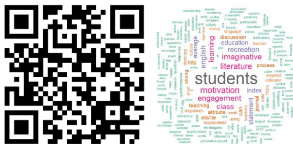
Gambar 2. Article file dan word cloud analisis data mining pada artikel “ Students’ motivation and engagement in the learning process of literature teaching using imaginative re-creation technique ”.

Kami menemukan 10 kata-kata yang paling banyak muncul pada masing masing artikel yang dilakukan analisis data mining. Berdasarkan abstrak artikel “ Students’ motivation and engagement in the learning process of literature teaching using imaginative re-creation technique ”, kata yang paling sering muncul adalah students sebanyak 107 kali, motivation sebanyak 52 kali, literature sebanyak 49 kali, engagement dan imaginative sebanyak 43 kali, learning sebanyak 42 kali, class sebanyak 41 kali, english dan recreation sebanyak 39 kali, dan education sebanyak 31 kali. Secara lengkap, analisis data mining pada artikel tersebut tersedia pada Gambar 2