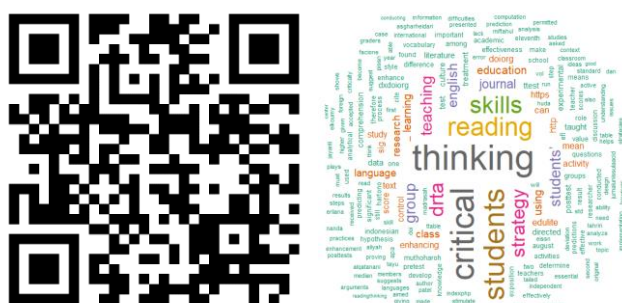
Gambar 6. Article file dan word cloud analisis data mining pada artikel “ Enhancing students’ critical thinking skills in reading class using the directed reading thinking activity (DRTA) teaching strategy ”.

Kami menemukan 10 kata-kata yang paling banyak muncul pada masing masing artikel yang dilakukan analisis data mining. Berdasarkan abstrak artikel “ Multimodal Project-Based Learning in listening and speaking activities: Building environmental care? ”, kata yang paling sering muncul adalah students sebanyak 140 kali, learning sebanyak 106 kali, multimodal sebanyak 78 kali, listening sebanyak 64 kali, projectbased sebanyak 56 kali, research sebanyak 41 kali, project sebanyak 39 kali, speaking sebanyak 38 kali, environmental sebanyak 34 kali, activities sebanyak 29 kali. Secara lengkap, analisis data mining pada artikel tersebut tersedia pada Gambar 5